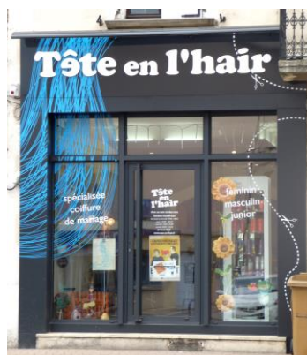
Tête de l'haïr (Livron-sur-Drôme)