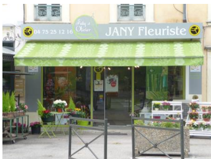
Jany Fleuriste (Crest)