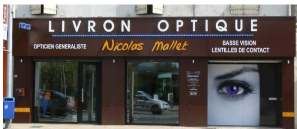
Livron Optique (Livron-sur-Drôme)