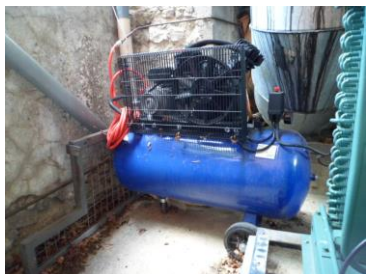
Les Salaisons du Mont d'Angèle (Bouvières)