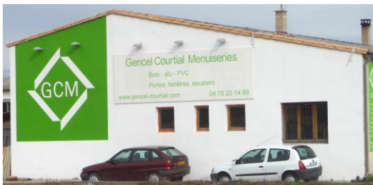
Menuiserie Gencel & Courtial (Aouste-sur-Sye)