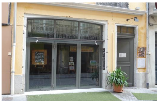
La Tartine (Crest)